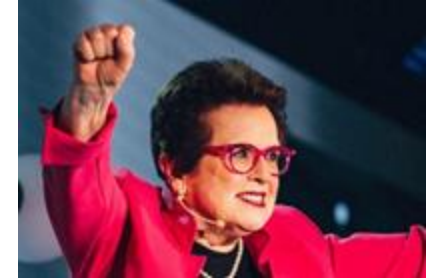
BILLIE JEAN KING